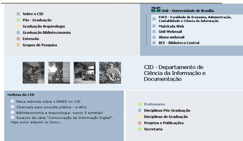
Figura 1 – Interface da página de abertura do portal www.cid.unb.br

Os alimentadores de conteúdo (professores, funcionários, alunos), desde que devidamente cadastrados e autorizados, têm a possibilidade de administrar livremente suas páginas, com autonomia de inserção e alteração de conteúdos. Essa lógica de controle e uso das informações deve ser uma ação disciplinada que prevê a evolução quantitativa de dados, permitindo a geração e gestão integrada de documentos, adaptadas a necessidades específicas. A comunidade interna, no entanto, ainda não se adaptou totalmente a essa dinâmica, muitas páginas ficam sem a devida atualização.. A estrutura desenvolvida comporta também espaço para a divulgação de notícias sobre eventos externos e internos que venham a contribuir para o aprimoramento das atividades do CID. O Portal terá em suas diversas páginas um caráter dinâmico, em um ciclo temporal definido.